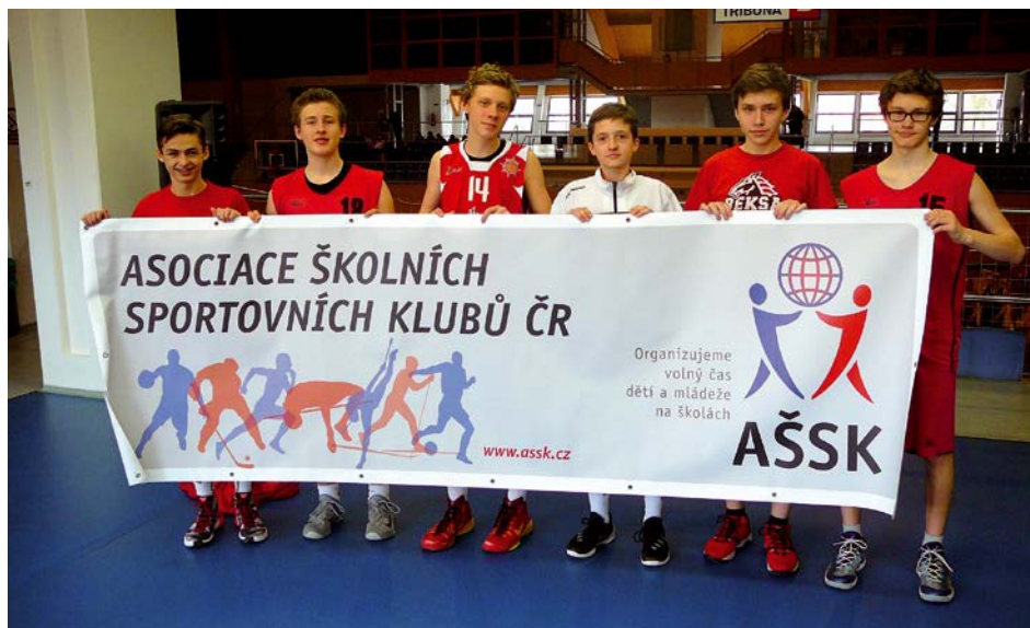
XIV. KO basketbal ZŠ – 1. místo ZŠ Studánka Pardubice