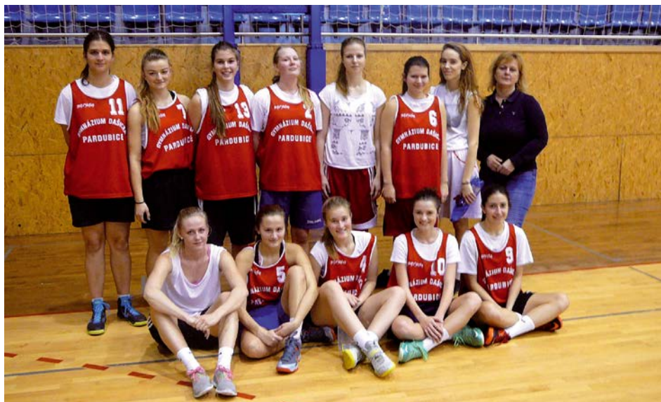
XIV. KO basketbal SŠ – 1. místo Gymnázium Dašická Pardubice