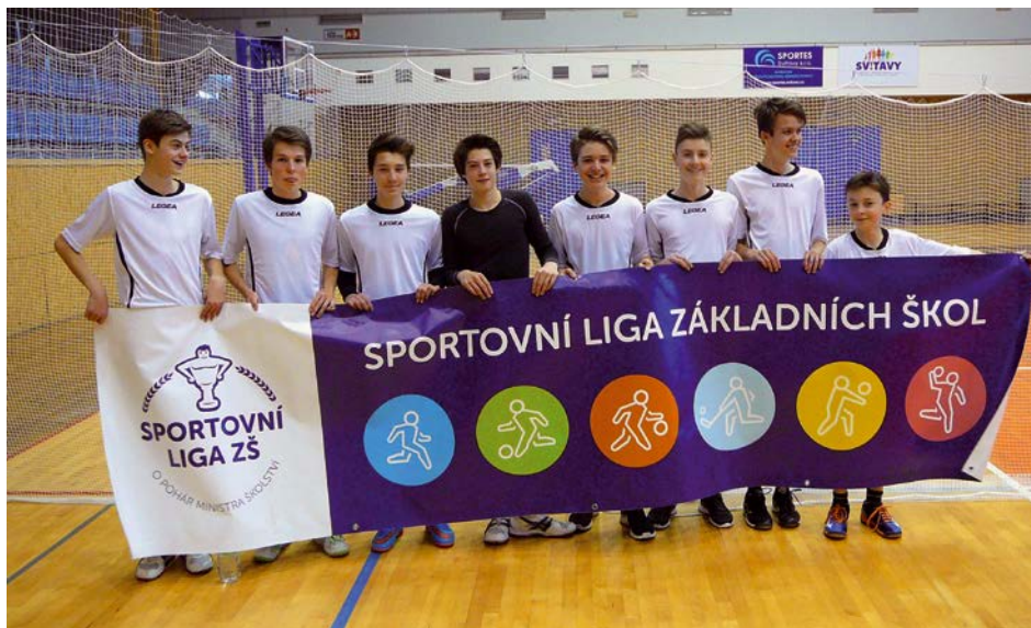
XIV. KO volejbal – ZŠ 1. místo Gymnázium Svitavy