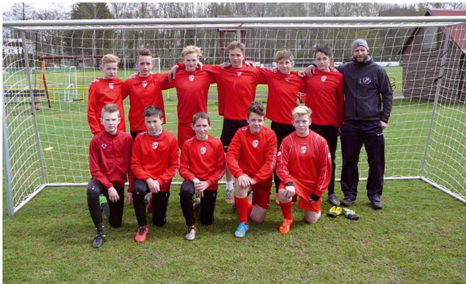
XIV. KO minifotbal – 1. místo ZŠ Ohrazenice