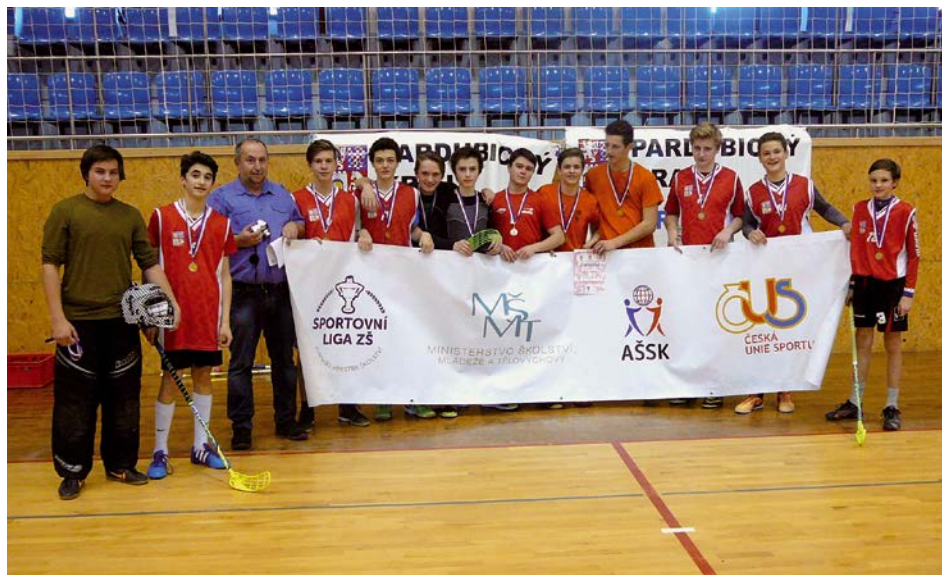
XIV. KO florbal – 1. místo ZŠ Studánka Pardubice