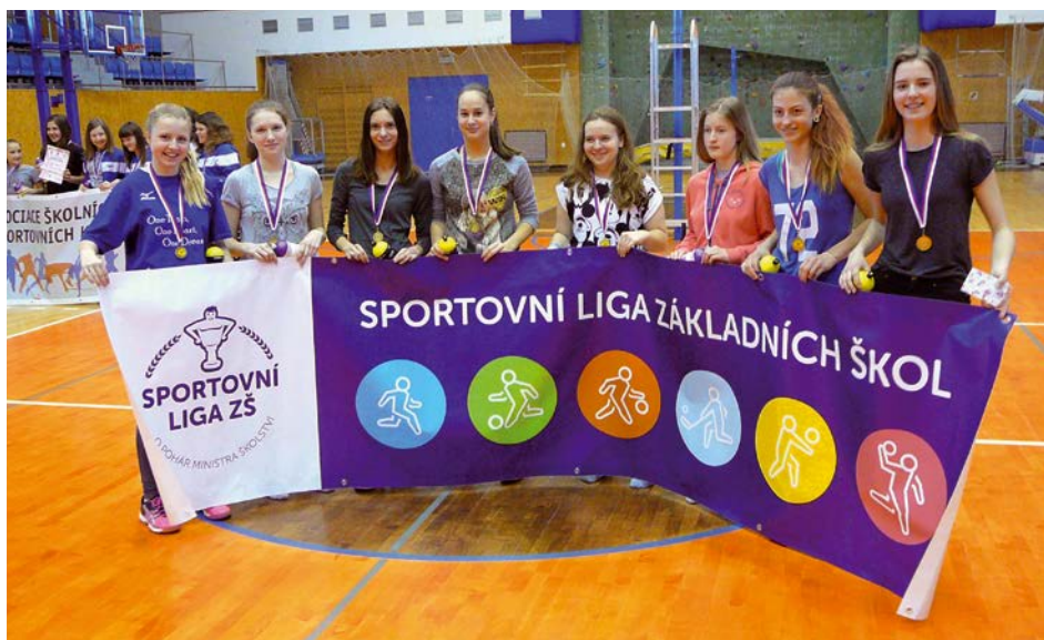
XIV. KO volejbal – ZŠ 1. místo Gymnázium Lanškroun