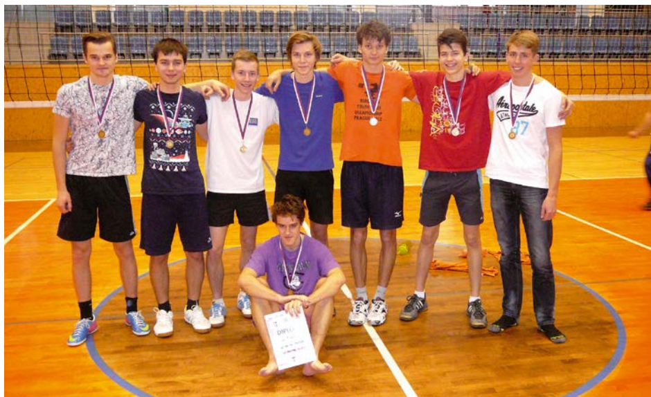
XIV. KO volejbal SŠ – 1. místo Gymnázium Dašická Pardubice