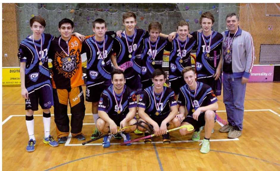
XIV. KO florbal – 1. místo Gymnázium Česká Třebová