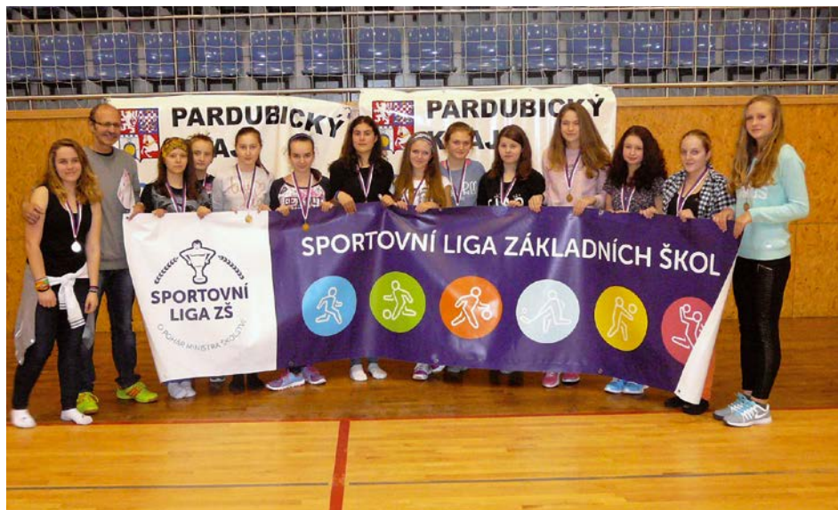
XIV. KO florbal – 1. místo Jablonné nad Orlicí