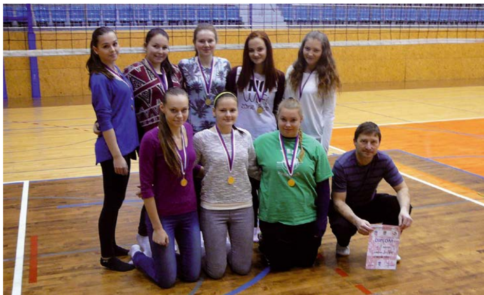
XIV. KO volejbal – SŠ 1. místo Gymnázium Svitavy