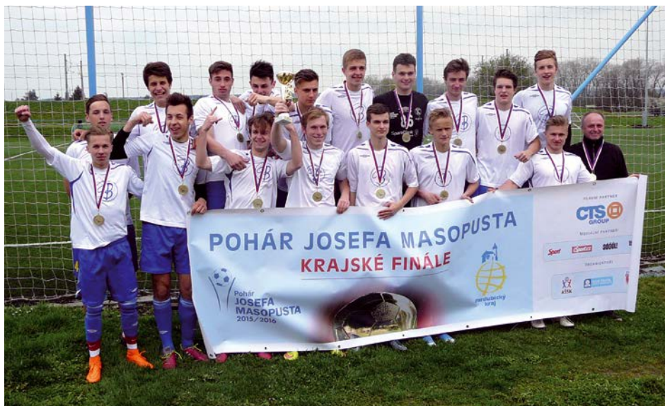
XIV. KO pohár Josefa Masopusta – 1. místo ZŠ a SŠ Bohemia Chrudim