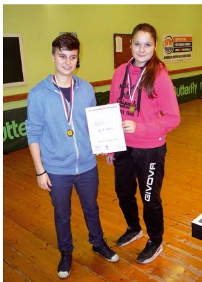
XIV. KO stolní tenis – 1. místo ZŠ aŠ Bohemia Chrudim