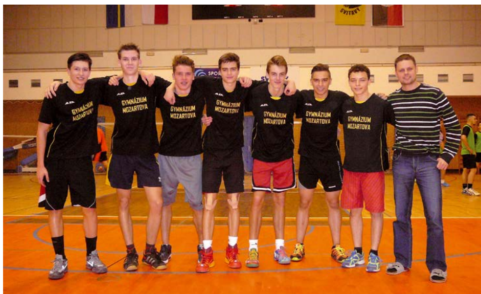
XIV. KO basketbal SŠ – 1. místo Gymnázium Mozartova Pardubice