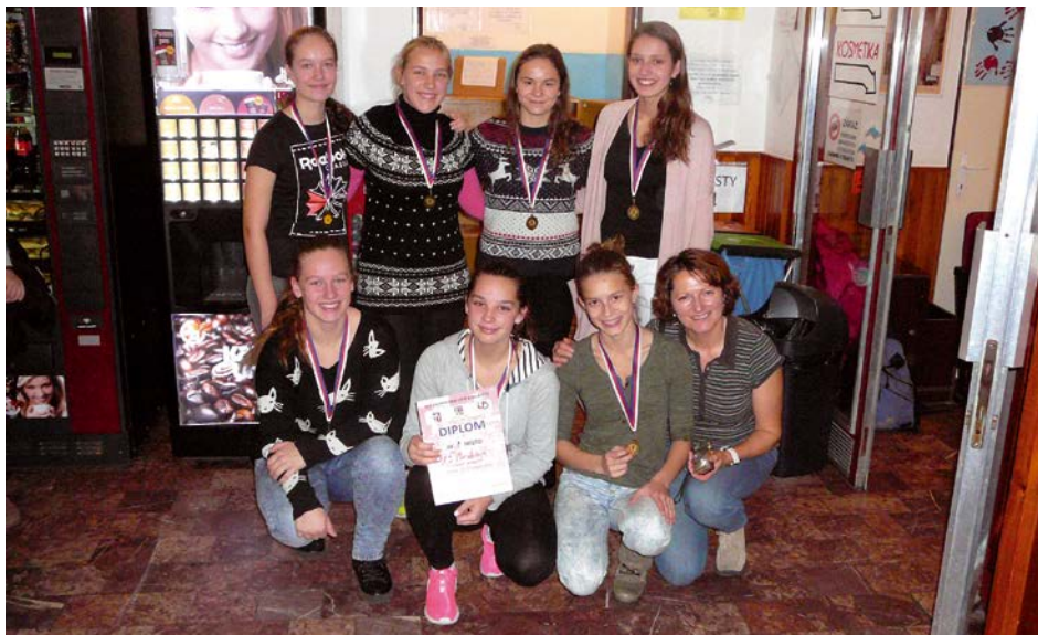
XIV. KO plavání – 1. místo ZŠ Benešovo náměstí Pardubice