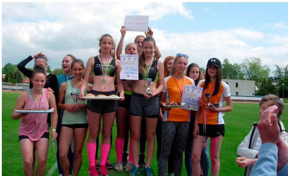
XV. KODM – Atletický čtyřboj ZŠ dívky – stupně vítězů