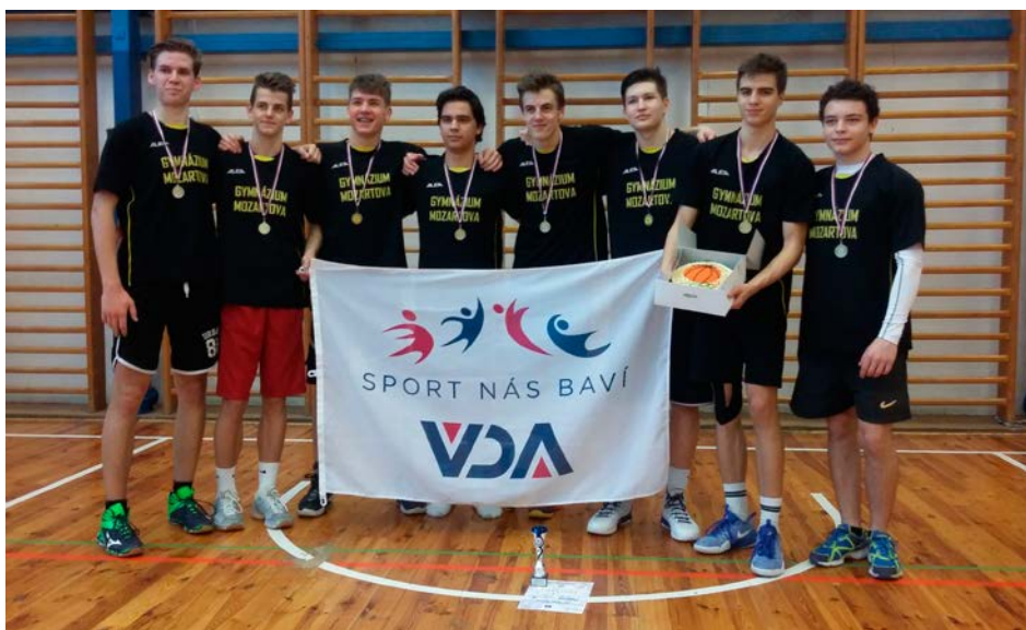
XV. KODM – Basketbal SŠ chlapci – 1. místo – Gymnázium Mozartova Pardubice