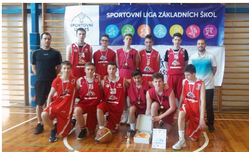
XV. KODM – Basketbal ZŠ chlapi – 1. místo – ZŠ Studánka Pardubice