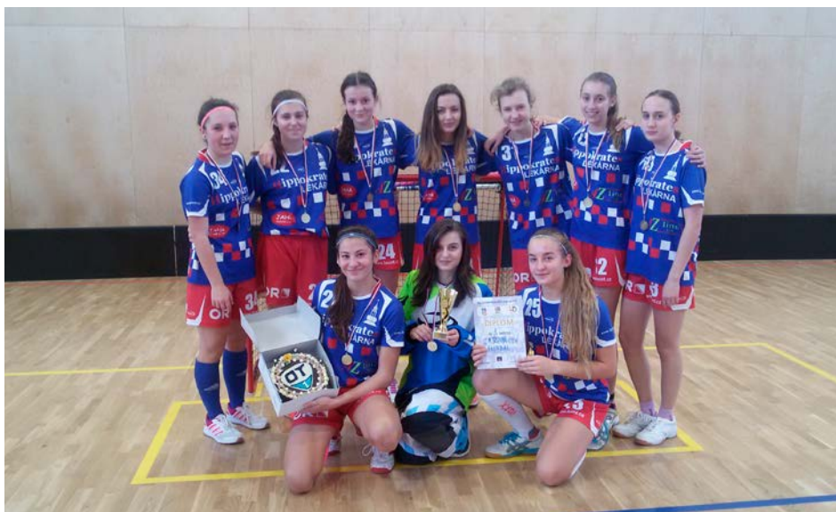
XV. KODM – Florbal ZŠ dívky – 1. místo – ZŠ Kostelní Moravská Třebová