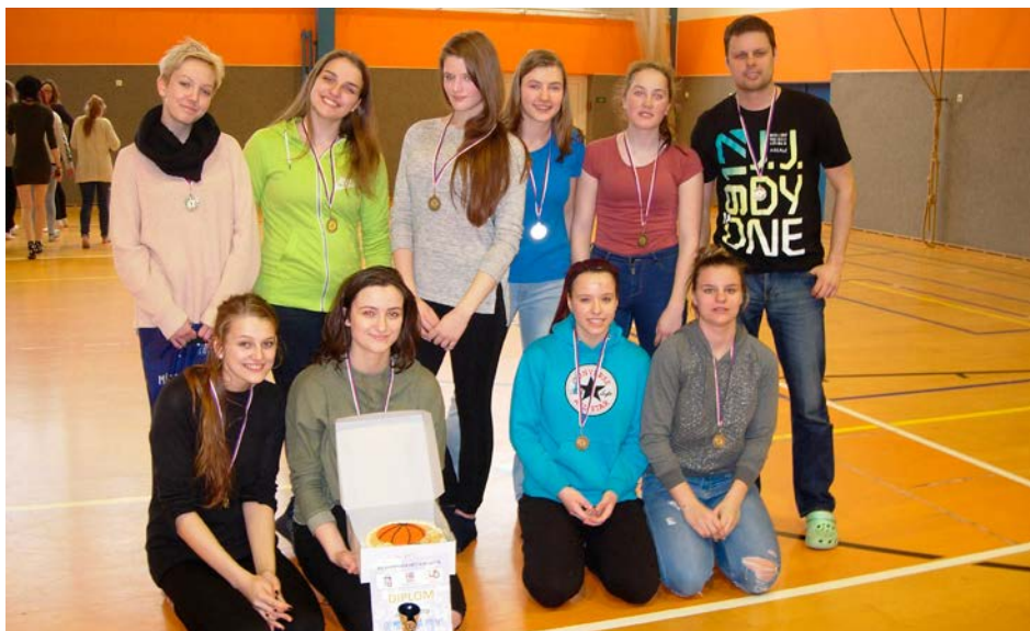
XV. KODM – Basketbal SŠ dívky – 1. místo - Gymnázium Mozartova Pardubice