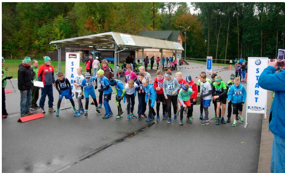
XV. KODM – Přespolní běh