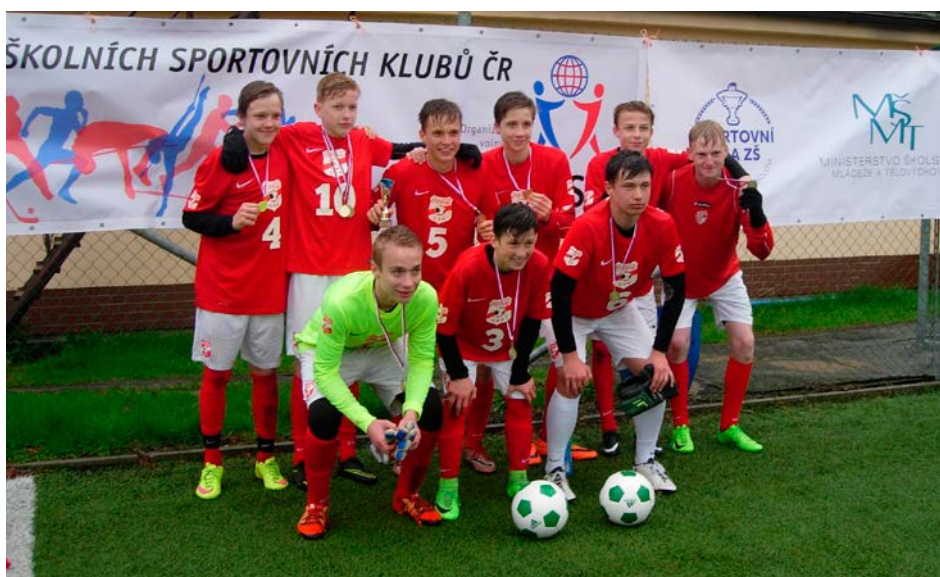
XV. KODM – Minifotbal ZŠ – 1. místo – ZŠ a MŠ Pardubice Ohrazenice