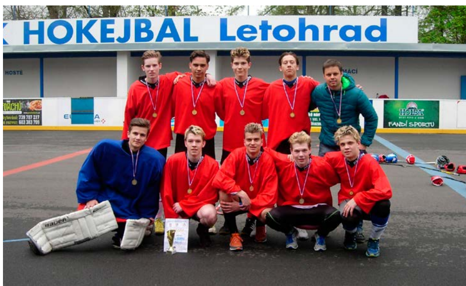
XV. KODM – Hokejbal SŠ chlapci – 1. místo – Gymnázium Mozartova Pardubice