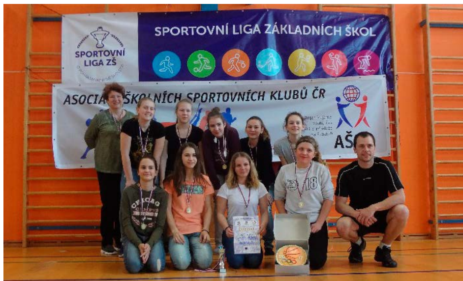
XV. KODM – Basketbal ZŠ dívky – 1. místo – ZŠ Polabiny 3 Pardubice