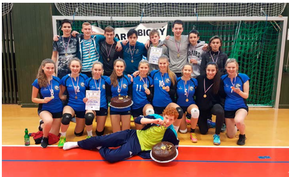
XV. KODM – Volejbal SŠ – 1. místa – Gymnázium Česká Třebová