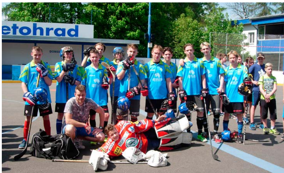
XV. KODM – Hokejbal ZŠ chlapani