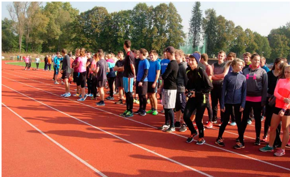
XV. KODM – Corny pohár