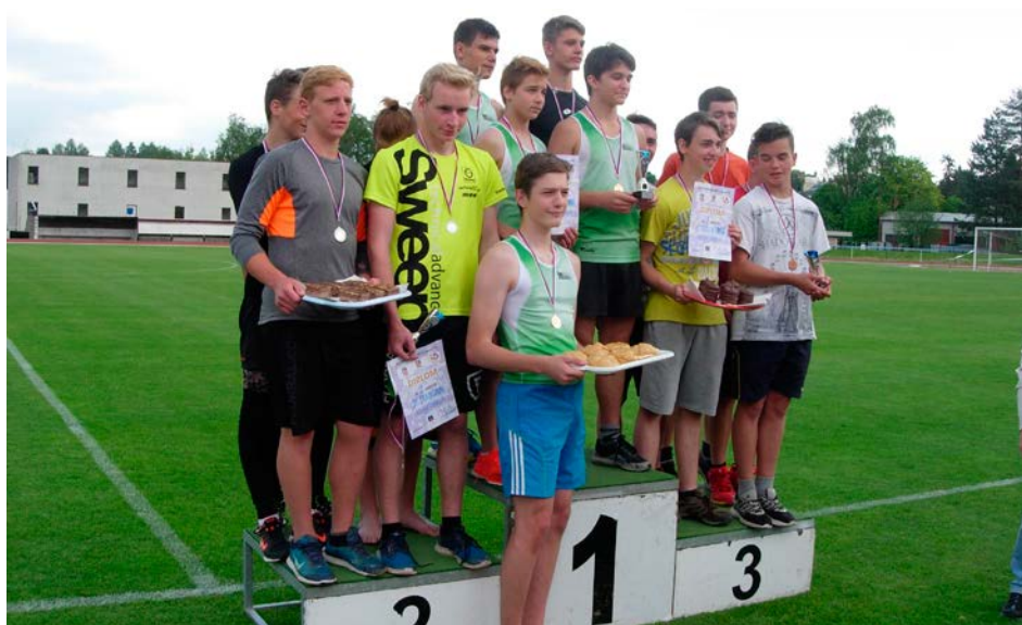
XV. KODM – Atletický čtyřboj ZŠ chlapci – stupně vítězů